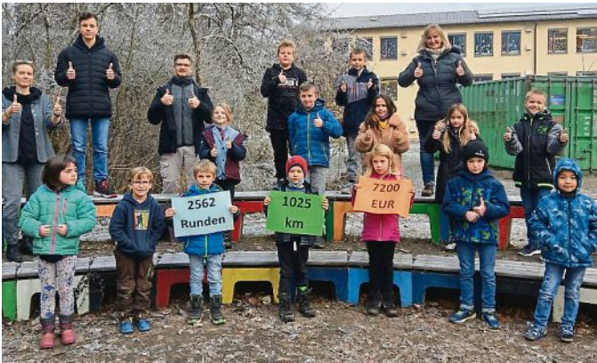
Schüler und Lehrer zeigen die gelaufenen Strecken

Bereits im Oktober fand an unserer Schule, der Grund- und Mittelschule Emmering, wieder ein Spendenlauf statt. Dabei suchten die Kinder der Schule