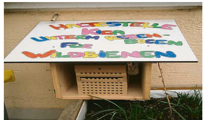
Hier haben die Wildbienen ein neues Zuhause.