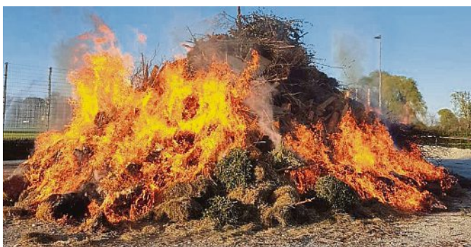
Das traditionelle Osterfeuer wird wieder entzündet.

Brennbares Material kann am Samstag ab 10 Uhr an den Osterfeuer Platz gebracht werden. Auf Wunsch holen die Burschen auch Ihr Holz bei Ihnen Zuhause ab. Hierfür melden Sie sich bitte unter der Mobilnummer 0178 6385916 bis zum Karfreitag.