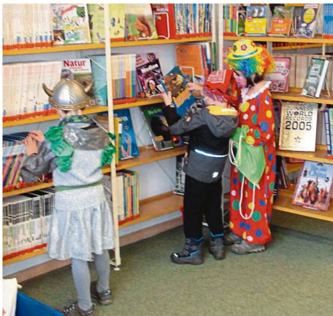
Leseratten aller Altersstufen sind in der Emmeringer Gemeindebücherei herzlich willkommen.

In regelmäßigen Abständen besuchen die Schulklassen der Grundschule Emmering nach Voranmeldung die Gemeindebücherei in Emmering, genießen die Büchereiführung und erfahren die Möglichkeit der Nutzung der Bücherei. Hier lernen die Schulkinder nicht nur spielerisch das Angebot der Gemeindebücherei kennen, sondern auch, sich in ihr selbstständig zurechtzufinden. So kann das Lernen an Schulen einfach abwechslungsreich gestaltet werden und die Freude am Lesen sowie die Kompetenz im Umgang mit Büchern und Medien nachhaltig gefördert werden. Ein optimaler auch außerschuli-