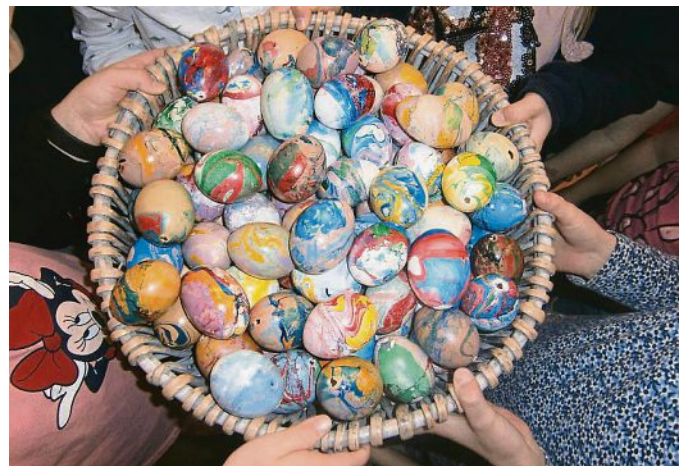
In der Oster-Bastel-Werkstatt kamen viele Eier zusammen.

Die Kinder des evangelischen Kindergartens „Unterm Regenbogen“ haben ihre Oster-Bastel-Werkstatt eröffnet. Für den Obst- und Gartenbauverein haben sie viele bunte Eier marmoriert. Die Eier wurden auf der Streuobstwiese an Frau Claudia Längler übergeben und werden in Emmering den Emhari-Brunnen schmücken. Der Kindergarten hat im Gegenzug für seine Wildbienen ein paar Streuobstwiesen-Ableger bekommen.