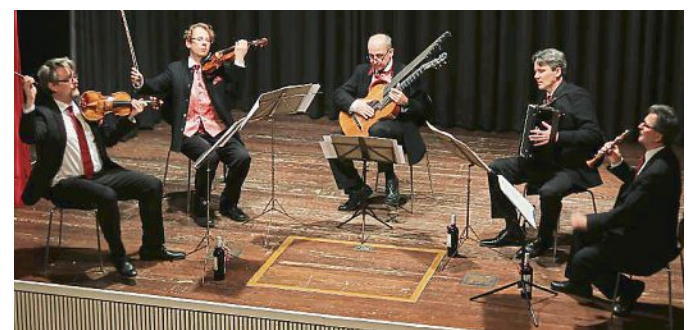
Philharmonia Schrammeln aus Wien zauberten Heurigenatmosphäre in das Bürgerhaus.

Es fehlte eigentlich nur „a Glaserl Wein“ und die Illusion, in einem Grinzing Heurigenlokal zu sitzen, wäre perfekt gewesen. Aber auch so gelang es den Philharmonia Schrammeln aus Wien mit Leichtigkeit, die Konzertbesucher im Emmeringer Bürgerhaus in eine ebenso beseelte wie beschwingte Stimmung zu versetzen. Mit Märschen, Polkas und natürlich Walzern unter anderem von Schrammel, Schubert, Lanner und Strauß bescherten die fünf Musiker – alle Meister ihres Fachs – dem Publikum einen bunten Strauß herrlicher Melodien, die zum Mitsummen und Mitschunkeln animierten. Authentische Spielfreude, technische Perfektion und vollendete Harmonie im Zusammenspiel zeichnen das En-