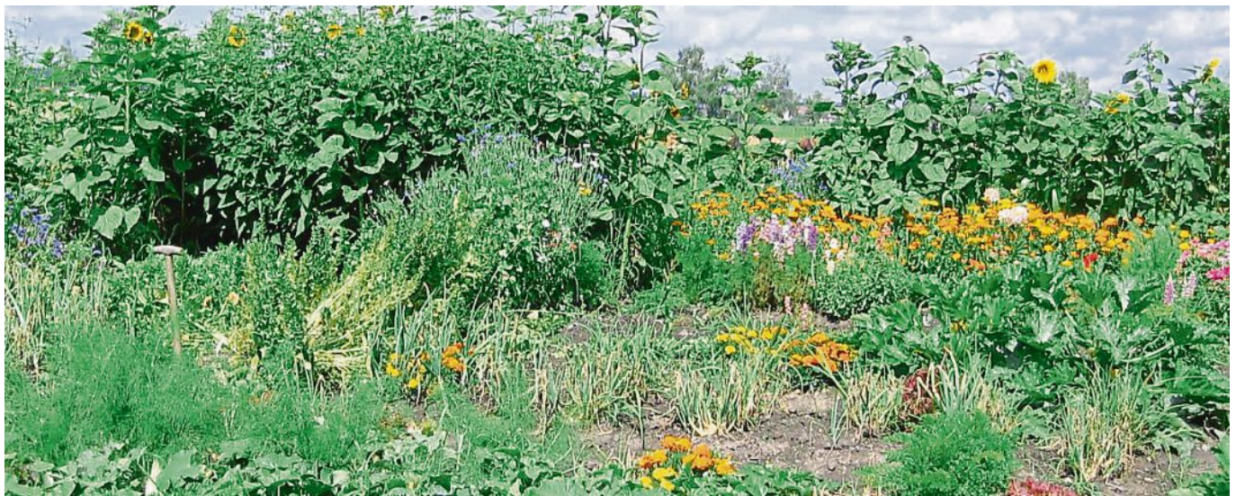
Der Frühling kommt – auch auf den Sonnenäckern der Gemeinde Emmering.

Das Gemeinschaftsprojekt von „Brucker Land“ und der Agenda21 erfreut sich seit vielen Jahren großer Beliebtheit, im ganzen Landkreis gibt es elf Standorte. Auch Emmering gehört dazu. Viele Pächter vom letzten Jahr haben sich jetzt schon wieder einen Bifang für die diesjährige Anbausaison reservieren lassen. Doch auch neue ‚Sonnenäcker‘ sind herzlich willkommen: Jeder kann mitmachen, denn das Prinzip ist einfach: für 60 Euro erhält man einen vom Landwirt saarfertig vorbereiteten Bifang – das ist ein 100 m langer Kartoffeldamm – auf dem er ab Mitte April selbst gärtnern kann.