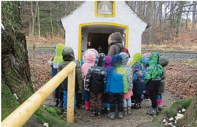
An der Emmeringer Kapelle hielten die Kinder eine kleine Feier ab.