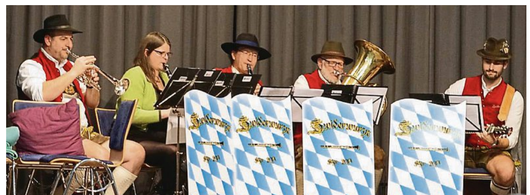
Beim letzten winterlichen Hoagart in 2019 spielten die „Zwiderwurzn“ auf.