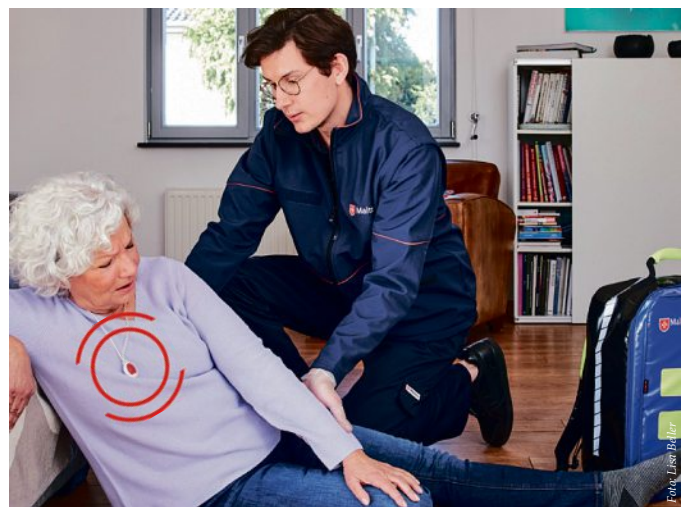
Der Malteser Bereitschaftsdienst ist immer einsatzbereit.

Älter werden bedeutet, mehr Hilfe in Anspruch zu nehmen – und das fällt vielen Menschen schwer. Daher kann ein Hausnotruf eine gute „Brücke“ sein: Es muss nicht immer ein anderer zur Seite stehen und dennoch kann zu jeder Zeit Hilfe gerufen werden, wenn sie mal wirklich nötig ist.