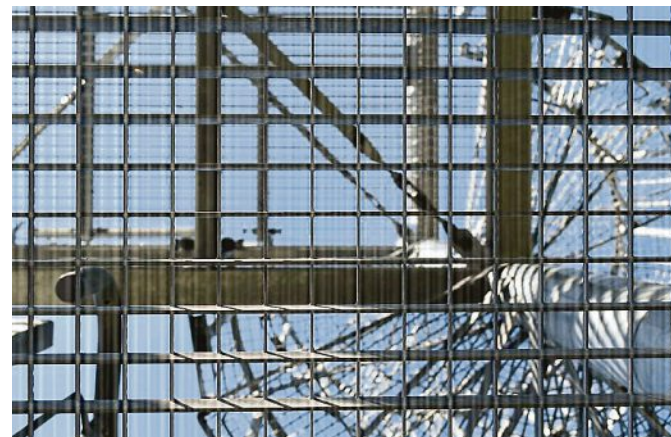
Rätsel Nr. 2: Was ist das?