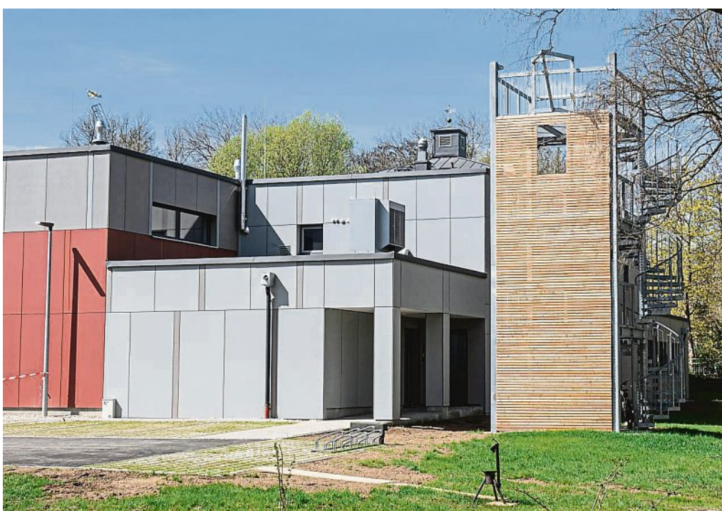
Endlich fertig – die Einweihung des neuen Feuerwärgärtehauses erfolgte im April 2023.

Einladung zur Informationsveranstaltung an alle Interessierten im Landkreis Fürstenteldbruck