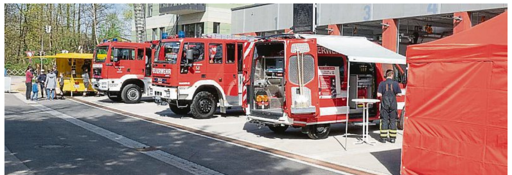
Die Freiwillige Feuerwehr Emmering präsentiert Neubau und Fuhrpark