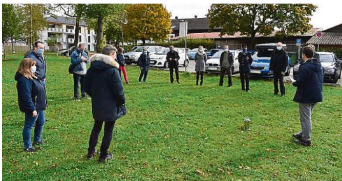
Bei der Grundsteinlegung 2020 musste man Abstand halten.