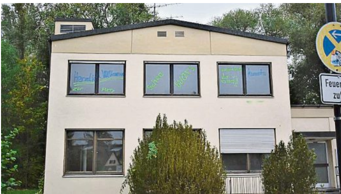
2020: Mit der Abrissparty Abschied nehmen.