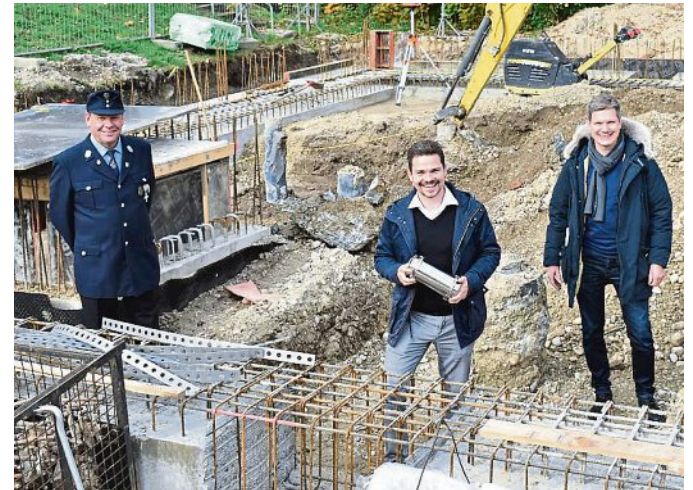
Die Grundsteinlegung erfolgte 2020 unter Corona-Regeln.