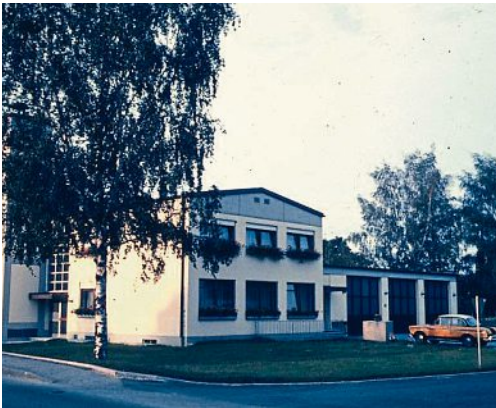
1973: Nach der Fertigstellung