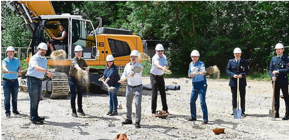
Der Spatenstich für den Neubau erfolgte noch im Jahr 2020