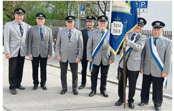
Eine Delegation der Krieger- und Soldatenkameradschaft besuchte mit einer Fahnenabordnung auf Einladung das 150-jährige Gründungsfest Ihrer Nachbarn der KSK Fürstenfeldbruck.