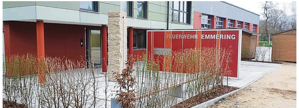
Die Einweihung fand im April 2023 statt – hier das Kunstwerk im Eingangsbereich.