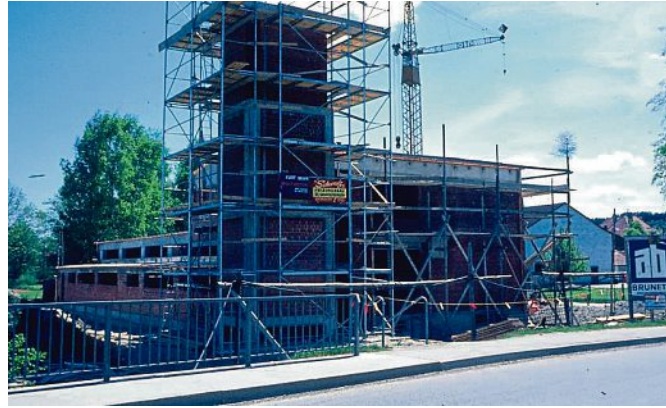
1973: Während der Bauarbeiten