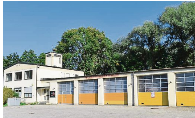
2019: Ansicht aus verschiedenen Blickwinkeln