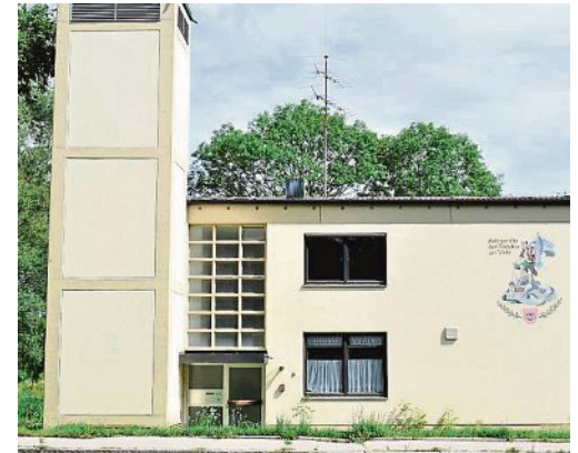
2019: Vor dem Abriss