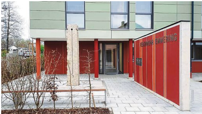
Kunst am Feuerwehrbau – der Eingangsbereich