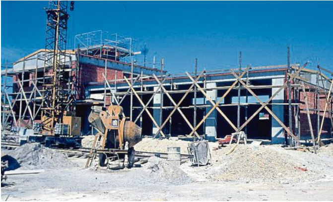
1973: Das Feuerwehrgerätehaus wuchs langsam in die Höhe.