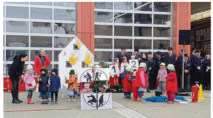
Im Titelblatt-Artikel der vergangenen Mai-Ausgabe „Freiwillige Feuerwehr öffnet ihre Tore“ hat sich leider ein Fehler teufel eingeschlichen und sein Lob falsch platziert: Es war nicht der Kindergarten Sausebraus der mit einer Einlage überraschte, sondern die Kinder des Kindergartens Unterm Regenbogen. Das Lob soll natürlich den Richtigen gebühren. Nochmals vielen herzlichen Dank an Euch Kinder – das Publikum war begeistert!