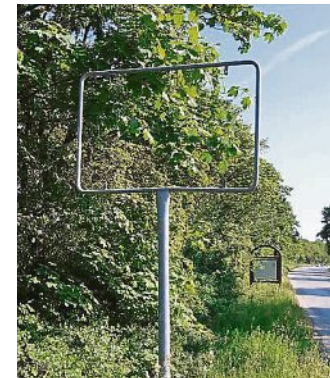
So traurig sieht der Ortseingang von Emmering ohne Ortsschild aus.

Die Gemeindeverwaltung bitet um sachdienliche Hinweise. Nur wenn alle Bürgerinnen und Bürger hinschauen und melden, kann mit den verhängten Strafen abgeschreckt und auch dem Vandalismus endlich Einhalt geboten werden. All diese Diebstähle und Sachbeschädigungen sind nicht nur sehr teuer und vor allem zeitintensiv, sondern auch äußerst sinnbefreit, denn die Kosten hierfür trägt die Allgemeinheit und wird aus Steuermitteln bezahlt. Somit sollte es doch einem jeden Bürger und einer jeden Bürgerin ein Anliegen