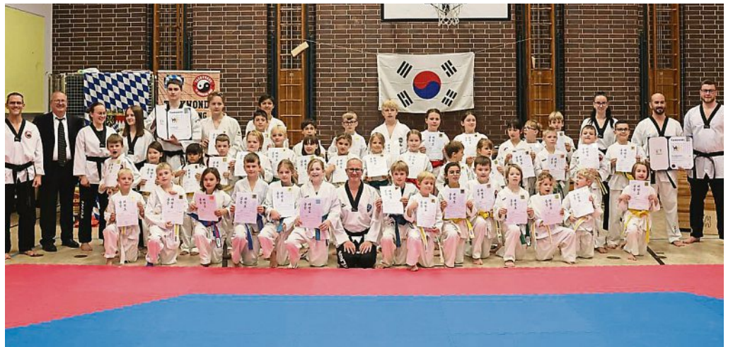
Ein herzliches Dankeschön an alle Trainerassistenten und Trainer für das motivierende Training und die hervorragende Vorbereitung (Foto links). Dies war Grundlage für das erfolgreiche Abschneiden der Sportlerinnen und Sportler.