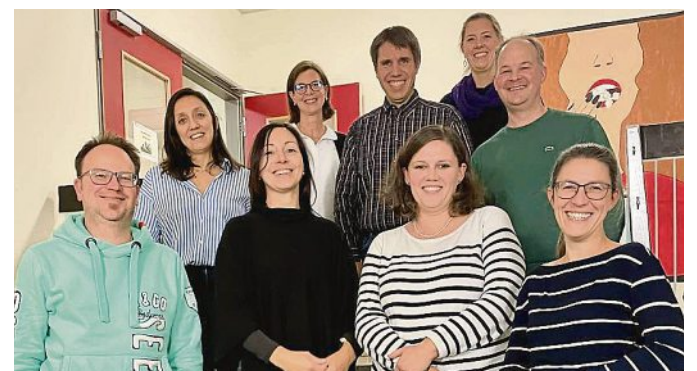
ton. Der neue Elternbeirat hat bereits seine Arbeit aufgenommen und freut sich auf die konstruktive Zusammenarbeit mit Förderverein und allen Eltern.