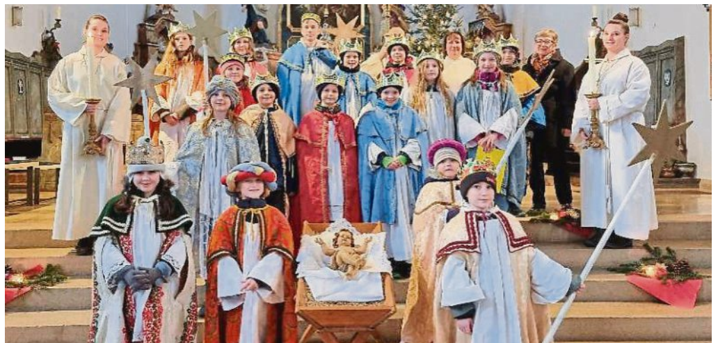
20*C+M+B*24 (Christus mansionem benedicat) „Christus segne dieses Haus und jeden der da geht ein und aus“. Die Sternsinger brachten den Segenspruch und die guten Wünsche in viele Häuser.