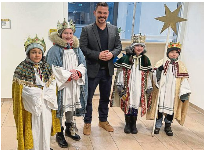
Auch im Rathaus der Gemeinde Emmering freute man sich sehr über den musikalischen Besuch mit Haussegnung.