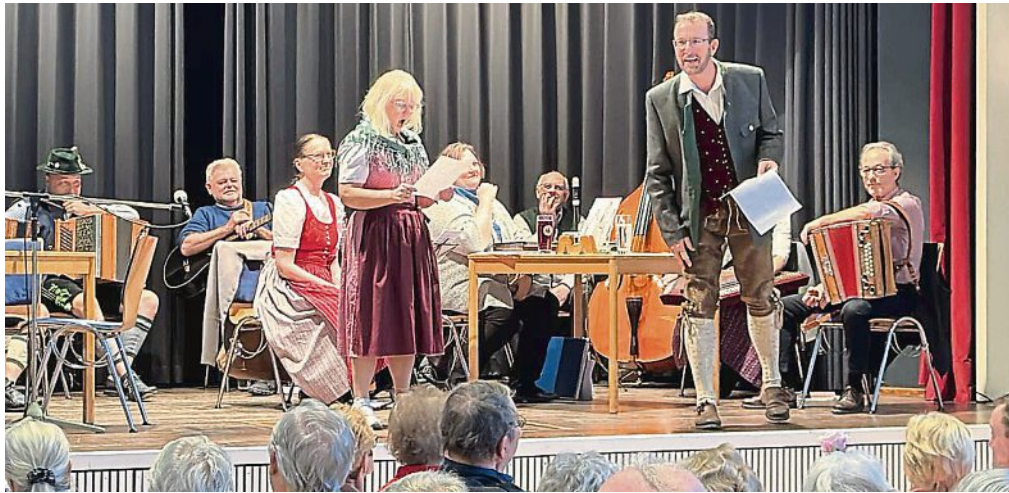
So stimmungsvoll ist der Hoagart im Emmeringer Bürgerhaus: Szene von 2023 aus einem Sketch „Der Theaterbesuch“.

Die Veranstaltung findet am Freitag, 23. Februar, im Festsaal des Emmeringer Bürgerhauses statt. Das Programm beginnt wie üblich um 16 Uhr und selbstverständlich wird vorab das beliebte Kuchenbüfett den kulinarischen Teil des Nachmittags