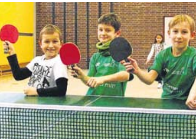
Diese drei Minis trainieren schon eifrig.