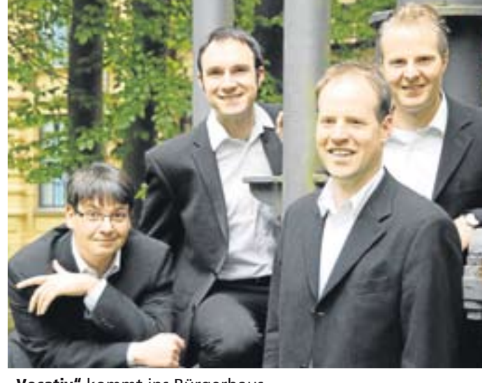
„Vocativ“ kommt ins Bürgerhaus.

Eine weit verbreitete Bildungsglücke wird übrigens gleich zu Anfang des Abends geschlossen: Johann Sebastian Bach – so wie er wirklich war. Das neu entdeckte und hoch moderne Elia-Oratorium erbringt den Beweis. Nebenbei transportiert das Ensemble (bestehend aus zwei Pfarrern, einem Arzt und einem Lehrer) gesellschaftliche und politische Themen. Transportmittel Nummer eins ist die Musik.