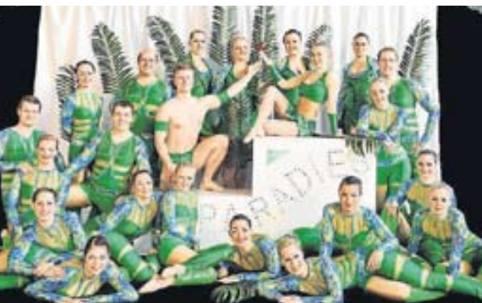
Die „New Dimension Velden“ ist zu Gast.

Neu in diesem Jahr ist ein Kinderfaschingsball in der Amperhalle am Sonntag, 10. Februar, von 14.30 bis 17.30 Uhr. Karten für vier Euro (Kinder ab zwei Jahren) und fünf Euro (Erwachsene) gibt es im Rewe-Supermarkt in der Unteren Au. Ein weiterer Kinderfasching wird vom katholischen Pfarrgemeinderat am 2. Februar von 14 bis 16.30 Uhr im Pfarrheim organisiert.