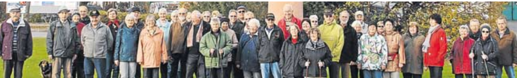
33 wetterfeste Wanderer hatten sich im November auf den Weg nach Puchheim gemacht.