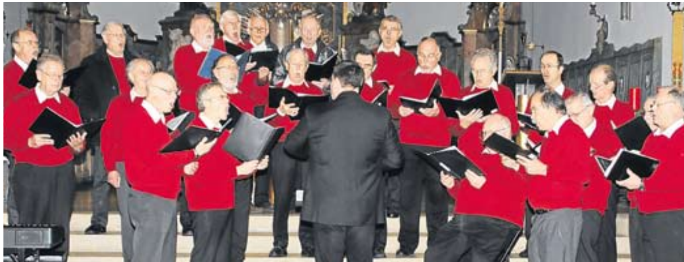
Die Kirche war erfüllt mit den Stimmen des Männerchores.

Den Anfang macht das Trio con brio, drei Schüler, zwei davon aus Emmering, mit einem Klavierstück zu sechs Händen, das ungeahnte Möglichkeiten dieses Instruments offenbarte. Der Männerchor folgte mit bekannten und beliebten Advents- und Weihnachtsliedern wie „Hör' in den Klang der Stimme“ oder „O Heiland reiß die Himmel auf“. Die verbindenden Wor-