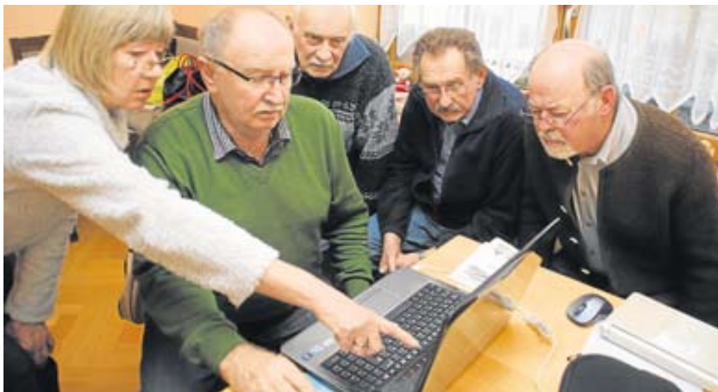
Gespannt verfolgten die Senioren die Erläuterungen am Computer.

18 Frauen und Männer haben sich zum ersten Computer-Stammtisch für Senioren im FCE-Stüberl getroffen. Allerdings stellte es sich heraus, dass der Wissensstand in dieser komplexen Materie sehr unterschiedlich ist. Demzufolge wird eine verbesserte Struktur eingeführt: Jeden ersten Montag im Monat werden künftig alle Fragen und Anliegen der Computer-Neulinge beantwortet und jeden dritten Montag im Monat ist das Treffen für die „Freaks“. Allerdings sollen diese beiden Gruppen zu einem späteren Zeitpunkt wieder zusammengeführt werden, damit hier auch in Zukunft ein Informationsaustausch erfolgt.