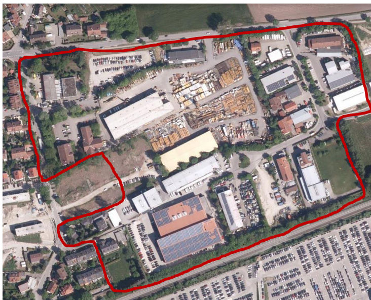
Abb.: Lage des Planungsgebiets, ohne Maßstab

Um das Ziel der stärkeren Wohnnutzung im Westen des Planungsgebiets weiter umzusetzen, wird ein Teilbereich in ein allgemeines Wohngebiet umgewandelt. Hierfür wird ein selbständiger vorhabenbezogener Bebauungsplan in einem eigenen Verfahren aufgestellt.